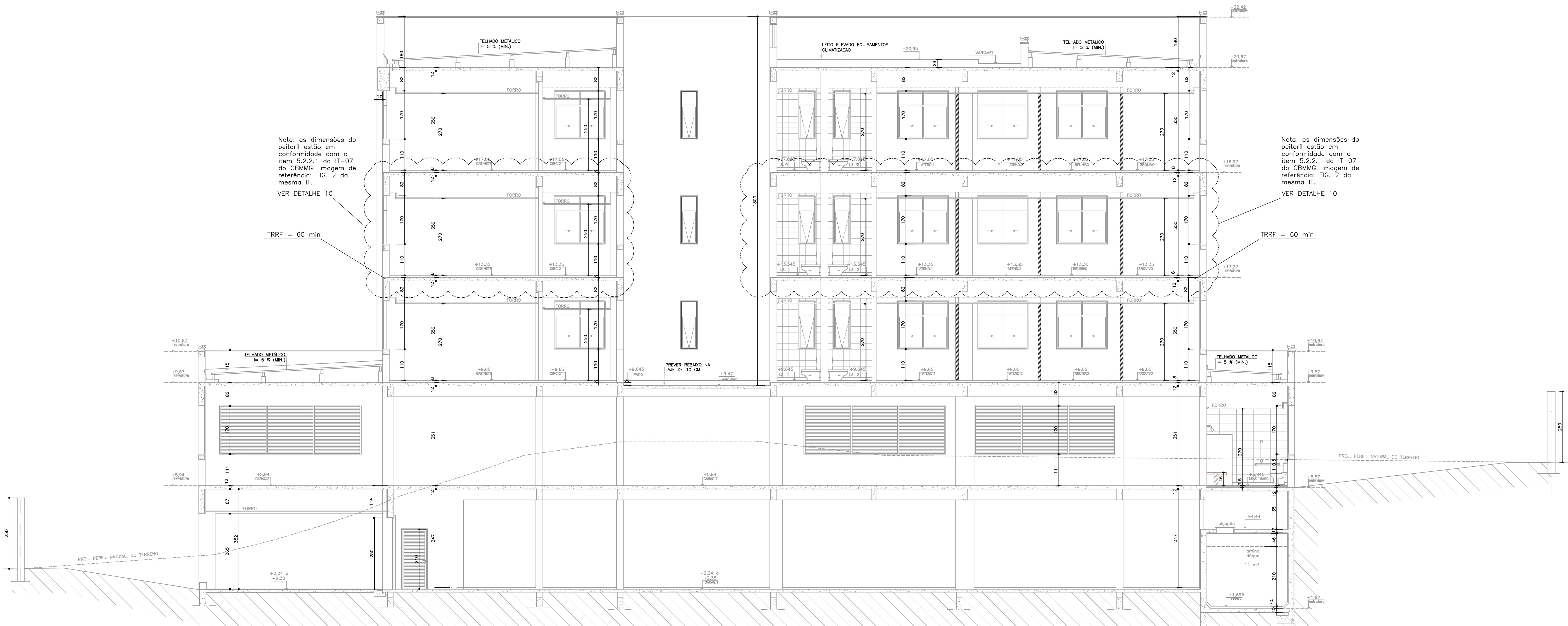
CORTE AA ESCALA 1/75